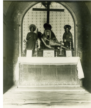
19 Capella de la Pietat de Sant Pere de Ripoll. ACRI