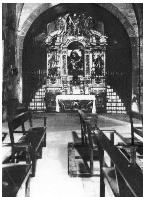
10 Capella de la Verge del Carme de Sant Pere de Ripoll.