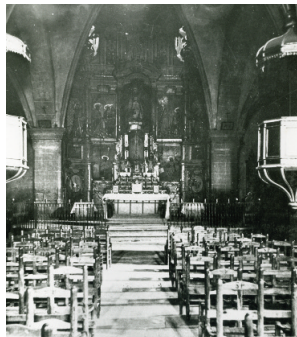
6 Altar Major de Sant Pere a finals del segle XIX.