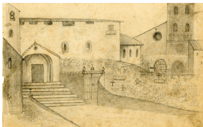
1 Dibuix de Sant Pere de Ripoll l'any 1851.