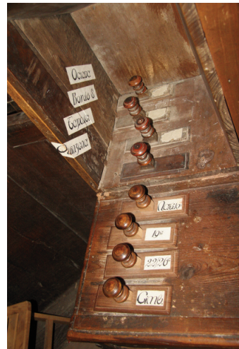
14 i 15 Josep Boscà, orguener, L'orgue de Cadaqués (1689-91).