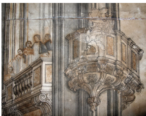
8 Pere Costa i Cases, escultor. Detall de la cantoria de la Catedral de Girona (1722).