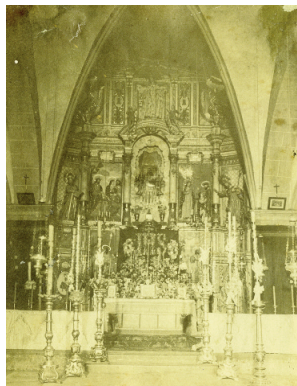
7 Altar Major de Sant Pere el mes de maig al segle XIX. ACRI