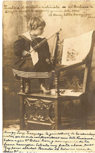
11 Un escolanet assajant.