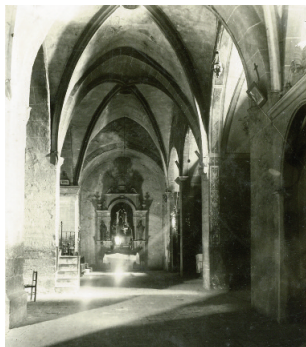
3 Capella de Sant Marc de Sant Pere de Ripoll. ACRI