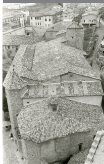
2 Perspectiva de Sant Pere de Ripoll l'any 1960. ACRI