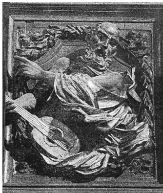
12 Gabriel Morató. Detall de l'orgue d'Illa de Conflent