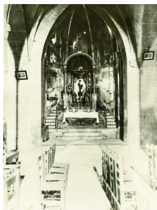
4 Capella de Santa Filomena de Sant Pere de Ripoll. ACRI