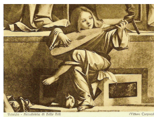
5 Vittorio Carpaccio. Detall d'un àngel músic. Venècia, Galleria dell'Accademia

festes de les confraries, en especial les completes i l'ofici promogudes els mesos de maig, agost i novembre per la confraria dels Àngels (il·lustració 5) i les festes patronals de les confraries de Santa Anna de teixidors de lli i de l'Esperit Sant de teixidors de llana. Se celebraven també amb música i absoltes els sants Marc, Miquel, Domènec, Esteve i Tomàs mentre els notables ripollesos i els comunitaris es feien enterrar "a cant d'orga" a l'altar major de Sant Pere (il·lustracions 6 i 7). Però sobretot són notables les fundacions que promouen que per la festa de la Verge de l'Esperança s'interpreti l'antifona de la O i que durant la missa del gall es canti el salm Misericordia Domine "ab orga tant la nit de nadal com a maitines".