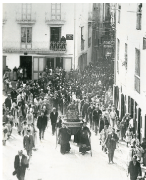
9 Processó de Sant Eudald, a començaments del segle XX a Ripoll. ACRI