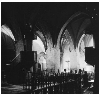
16 Interior de l'església de Sant Pere de Ripoll.